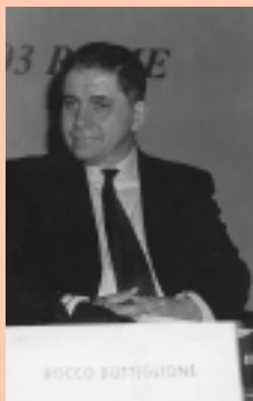
On. Rocco Buttiglione, Ministro per le Politiche Comunitarie